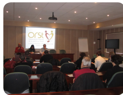
Réunion d'information de l'ORST sur le Document Unique en Lozère

➔ Ces actions doivent être applicables immédiatement lorsque le risque est important, ou planifiées sur une période plus longue lorsque le risque est plus faible. Tout dépend donc de la classification des risques effectuée lors de l'évaluation des risques.